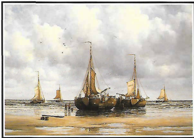
Bomschepen op het strand 海灘上的荷蘭漁船