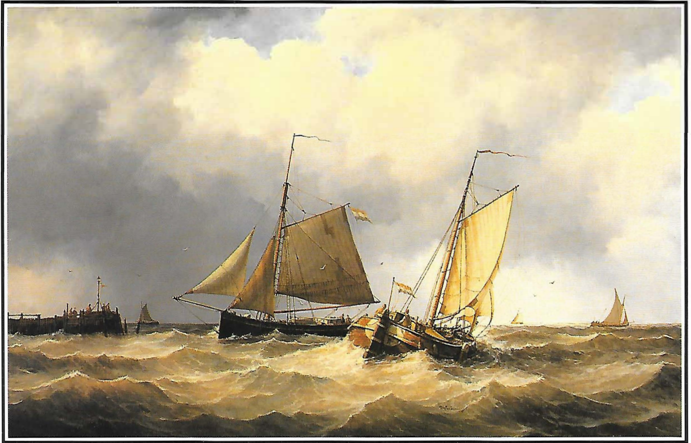
De haven voor de boeg 駛進避風所的船

zijn huisje annex atelier is bezaaid met honderden boeken waaruit hij de details van de rompen en tuigage van de schepen haalt die op zijn schilderijen te zien zijn.