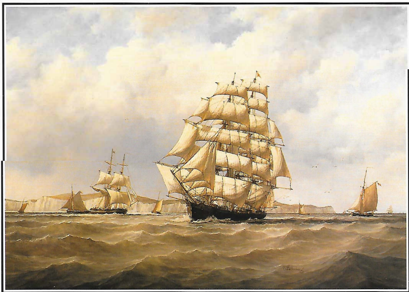
De kliffen van Dover Dover的懸崖

Sterkenburg heeft de buitengewone gave om luchten en water te schilderen die bijna echt lijken. De woonkamer van