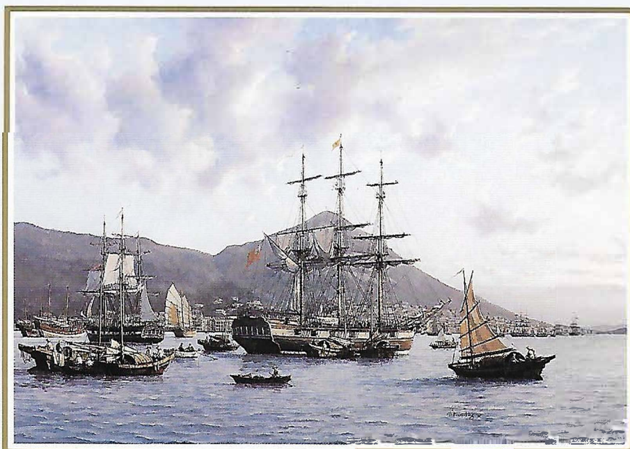
Hong Kong 1860, Victoria Harbour (Afmeting incl. . lijst ca 115 x 85 cm)

"Havens van Azië en Australië, nu en in het verleden" wordt zijn tweede tentoonstelling in Azië en zijn eerste in Australië. Voor de 20 schilderijen die op de tentoonstelling te zien waren, maakte Sterkenburg afgelopen voorjaar een verkenningsreis om de havens en zeegezichten van Penang, Malakka, Singapore en Sydney te bestuderen. Maritieme kunstverzamelaars zullen de schepen en havens uit het verleden kunnen bewonderen en waarderen, evenals hedendaagse afbeeldingen.