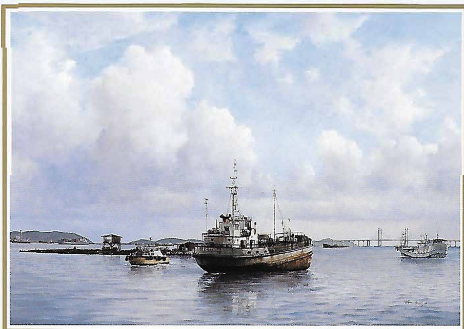
Penang 1995, met Penang Bridge (Afmeting incl. . lijst ca 115 x 85 cm)

Peter Sterkenburg accepteert speciale opdrachten en zal persoonlijk bij alle tentoonstellingen aanwezig zijn.