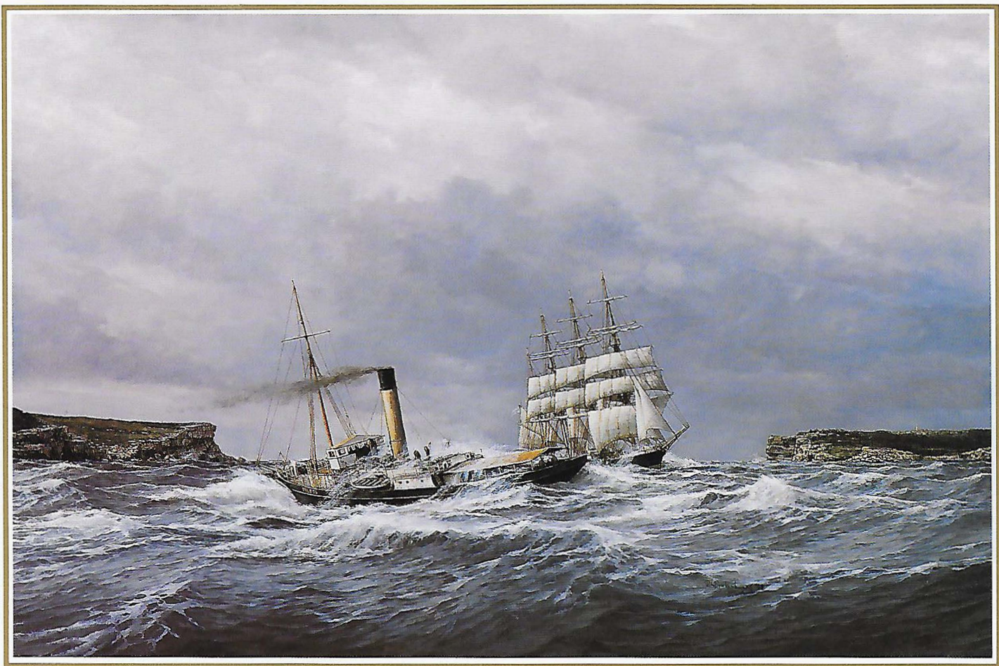
Loof.sboot "Captain Cook,II", :Nortli ancf Soutli Heacf, Sycfney 1925 ( Afmeting incl. lijst ± 125 95 cm)