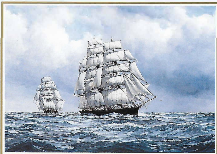
De 'Cutty Sark' in een theerace, 1870 (Afmeting incl. . lijst ca 95 x 75 cm)

Opmerking: Alle schilderijen in de tentoonstelling zijn te koop, maar worden pas aan de kopers ter beschikking gesteld na 1 juli 1996 als de tentoonstelling Kuala Lumpur, Singapore, Sydney en Djakarta heeft bezocht.