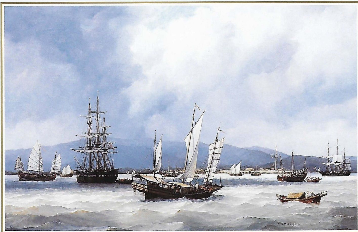
Penang, Georgetown 1850 met het oude fort op de achtergrond (Afmeting incl. lijst ca 95 x 75 cm)

traditie van de Nederlandse maritieme schilderkunst. Sterkenburg heeft het buitengewone vermogen om luchten en water te schilderen die bijna echt lijken. De woonkamer van zijn kleine huis, annex atelier is bezaaid met honderden boeken waaruit hij de details van rompen en tuigages van schepen haalt die op zijn schilderijen te zien zijn. Zijn kracht ligt in zijn vermogen om oude schepen en havens te schilderen alsof hij in die bepaalde eeuw leefde. Dit vereist vaak dagen van studie omdat hij precies moet weten welke gebouwen in die bepaalde periode aan de waterkant stonden. Om de lichthoek op zijn historische schilderijen te bepalen, moet hij ook uitzoeken waar en wanneer de zon opkwam of onderging - fijne details