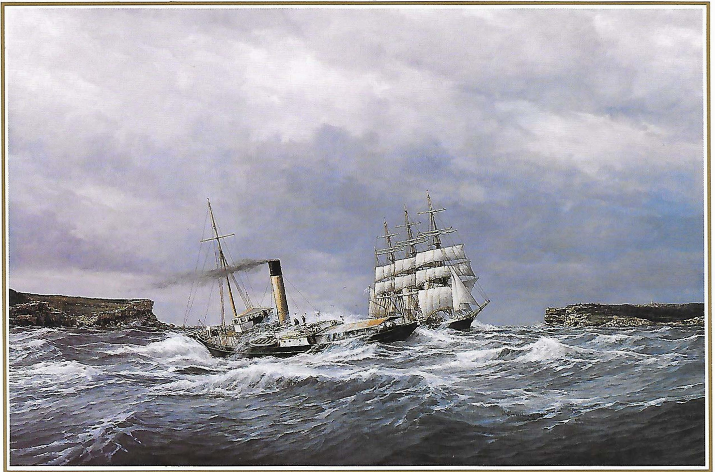
Loodsboot "Captain Cook, II", North and South Head, Sydney 1925 (Afmeting incl. lijst ± 125 x 95 cm)