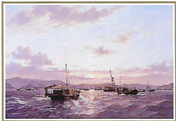
Hong Kong 1995, Victoria Harbour (Afmeting incl. lijst ca 115 x 85 cm)

Door tal van opdrachten was het voor de kunstenaar moeilijk om een solotentoonstelling in het buitenland te houden. Pas in november 1992 kregen kunstliefhebbers in Azië