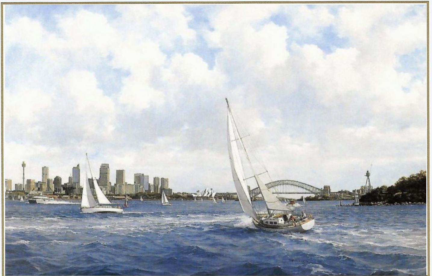
Sydney Harbour 1995 met rechts Bradleys Head (Afmeting incl. lijst ca 150 x 115 cm)

Het talent van de kunstenaar in het weergeven van romantische zeegezichten met een unieke kleur en stijl plaatst hem in de lange