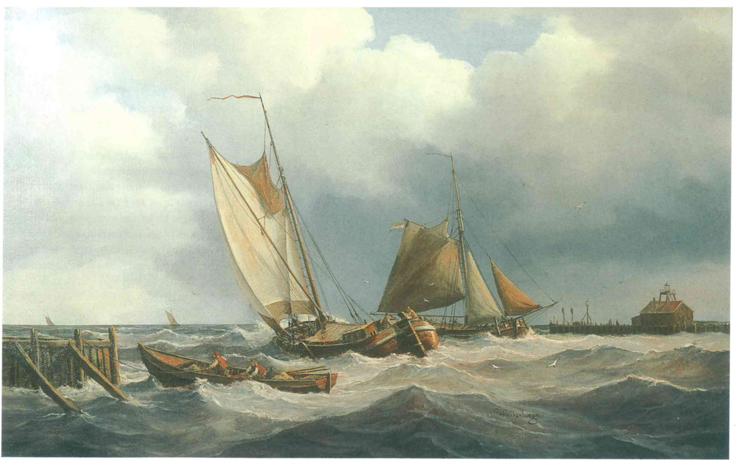
Tjalken voor haveningang. Collectie F.V. van Lith, België. Olieverf op linnen, 50 x 70 cm. Geschilderd in 1984.